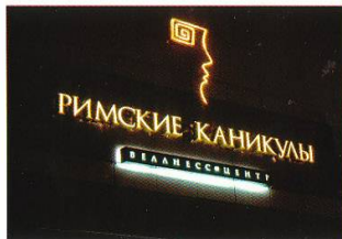
◀ Номинация «Вывеска площадью до 6 м²» «СанСитиАдвертайзинг» (Санкт-Петербург) Вывеска «Римские каникулы»