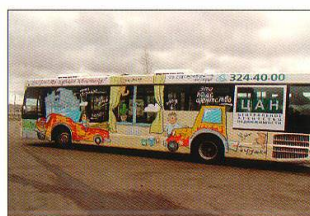
◀ Номинация «Реклама на транспорте» RED LINE MEDIA (Санкт-Петербург) Центральное агентство недвижимости