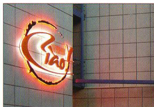
◀ Номинация «Вывеска с применением неоновых технологий» «Ориентир-М» (Красноярск) Вывеска Coffee-bar Ciaо