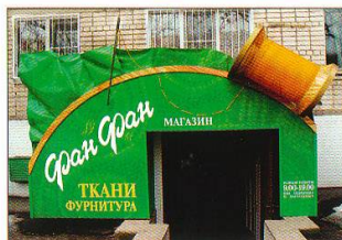
◀ Номинация «Комбинация технологий» «Графическое предприятие № 5» (Ставрополь) Магазин «Фан-Фан»