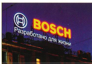
◀ Номинация «Вывеска с применением объемных букв» PVG (Санкт-Петербург) Крышная установка BOSCH